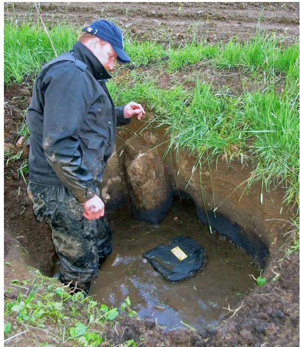
Afb. 2 - Bemonstering van paal 5 (2003)